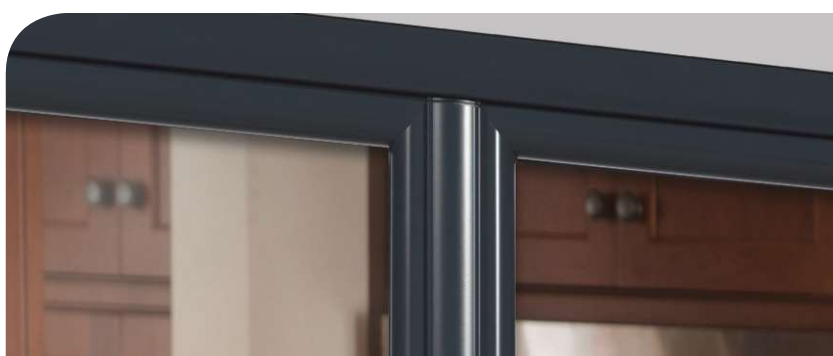
Battement Séduxia, vue extérieure

Les fenêtres et portes-fenêtres SÉDUXIA sont composées de profilés bois assemblés par coupe d'onglet et d'une ligne extérieure arrondie assurant une finition moderne et de qualité.