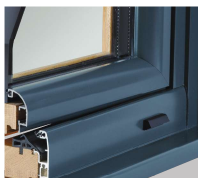
Capotage Alu arrondi