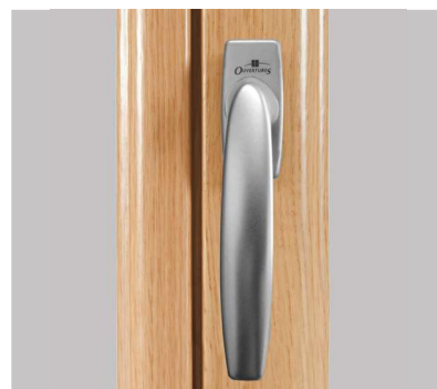
Battement réduit de 11 cm