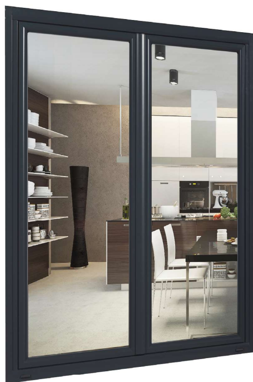
Fenêtre Séduxia vue extérieure - Noir profond Ral 9005